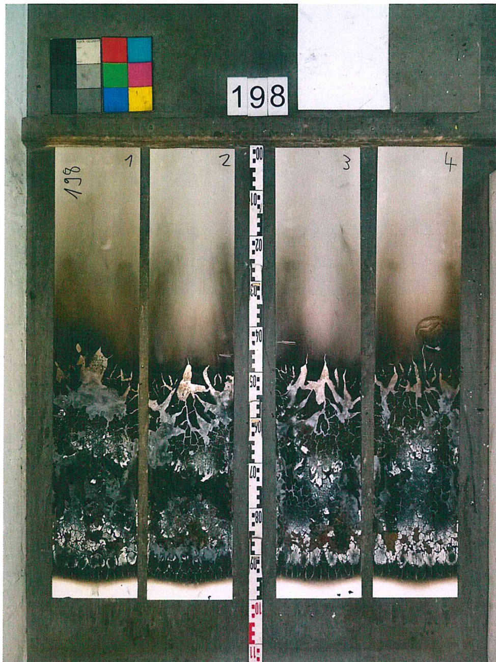
Bild 1 : Aussehen des Probekörpers B nach dem Brandschachtversuch